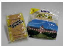
トラピストクッキー トラピストバター飴 (北斗市)