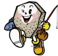
カールス君 (鹿部町)