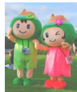
ポロトくん・ポントちゃん (七飯町)