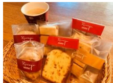
ミニアップルパイ・クッキー (七飯町)