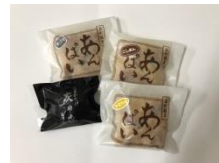
炭の森・あんばい (森町)