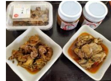
つぶ煮・ヤバいかきラー (鹿部町)