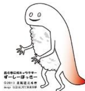
ずーしーほっきー (北斗市)