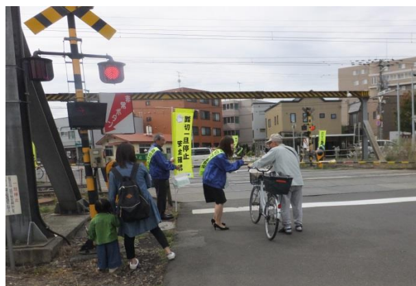
踏切事故防止キャンペーンの様子