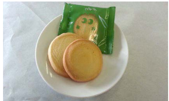
「ヤチボさぶれ」(イメージ)