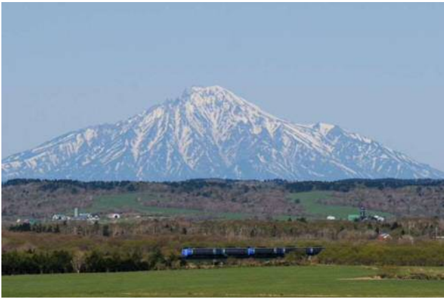
【サロベツ原野と利尻富士】