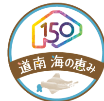
ヘッドマークイメージ