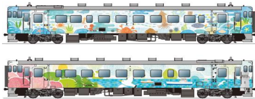
車両外装イメージ①