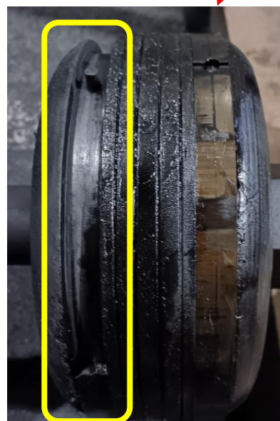
活塞環破損 ( 黃色框線部分 )