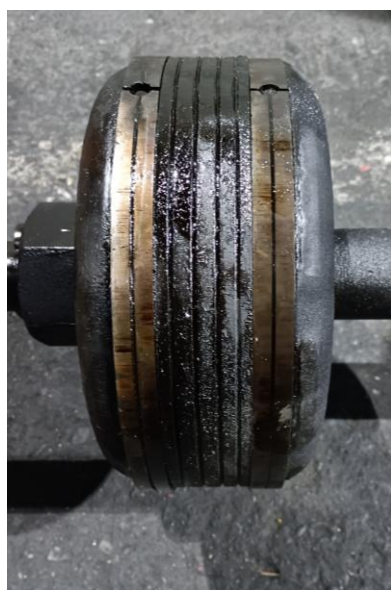
※參考：正常的活塞環