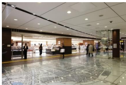
限定商品や限定ショップが並ぶ「銀の鈴エリア」