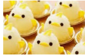
ぴよりん/愛知県 こだま 704号(東京駅 10:48 着) (JR 東海)