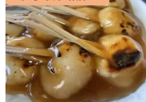
両棒餅(ちゃんぼ餅)/鹿児島県 さくら 544号⇒こだま 728号 (東京駅 16:48 着) (JR 九州)