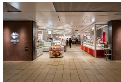
スイーツ・デリが揃う「京葉ストリートエリア」