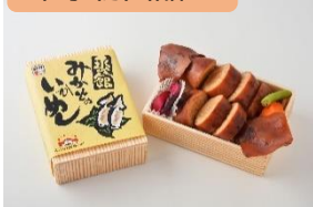
函館みかどのいかめし/北海道 はやぶさ 14号(東京駅 12:08 着) (JR 北海道)