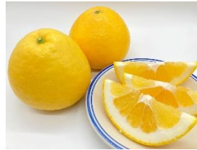
河内晩柑/愛媛県 しおかぜ 6号⇒こだま 720号 (東京駅 14:48 着) ※5/17(金)のみ輸送 (JR 四国)