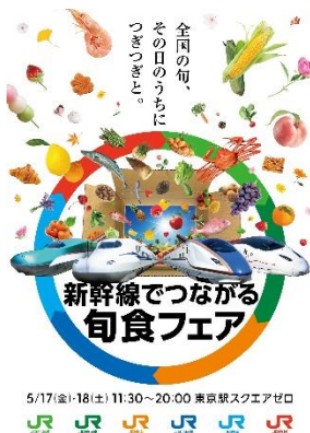
イベントポスターイメージ