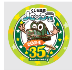
35周年記念ヘッドマーク デザインのマグネット