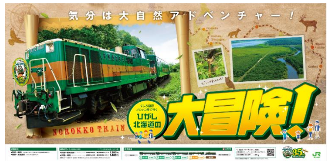
上図：パネルイメージ