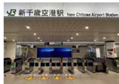
8 JR新千岁机场车站检票口 站台在地下2层。