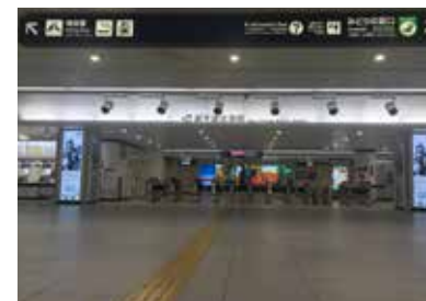
6 从地下1层下电梯后向右走，可以看到JR外籍旅客服务处。