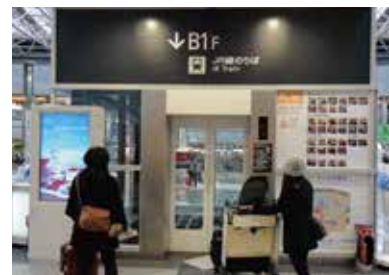
5 乘坐国内线航站楼的电梯前往地下1层。