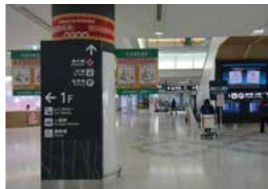
1 国际线航站楼 2层到达大厅。

从新千岁机场国际线候机楼前往札幌市内，搭乘列车十分便利。 新千岁机场和札幌站之间营运的列车为区间快速Airport号、快速Airport号、特别快速Airport号。 从国际线候机楼前往JR新千岁机场车站的道路指南信息如下。