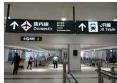
2 穿过约240米的连接通道前往国内线航站楼。