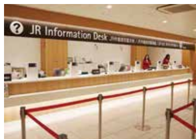
7 JR外籍旅客服务处 可兑换铁路周游券、购买JR车票。