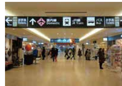
3 国内线航站楼 一直往前走。