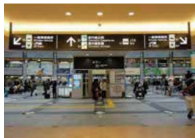
4 穿过小商店后可以看到国内线航站楼的电梯。