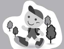
JRヘルシーウォーキング イメージキャラクター「歩くん」