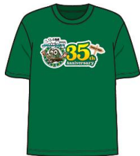
35周年ロゴプリント Tシャツ(子ども用)

毎年ご好評いただいているノロッコ号プリンや沿線地域の特産品のほか、今年は35周年を記念したオリジナルグッズを数量限定で販売します。旅の記念に、ぜひ車内販売をご利用ください。