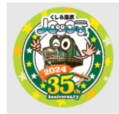
35周年記念ヘッドマーク デザインのマグネット