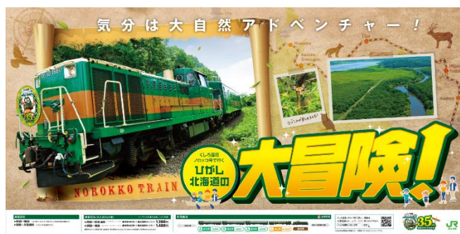
上図：パネルイメージ