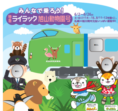
<b. 旭川観光物産情報センター 顔はめパネル>