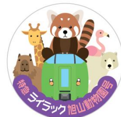
オリジナル缶バッジ

2018年6月2日（土）～8月26日（日）の土日 ※7/14（土）～16（月祝）、8/11（土祝）・12（日）を除く ※特急「ライラック旭山動物園号」運転日