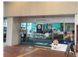
旭川観光物産情報センター