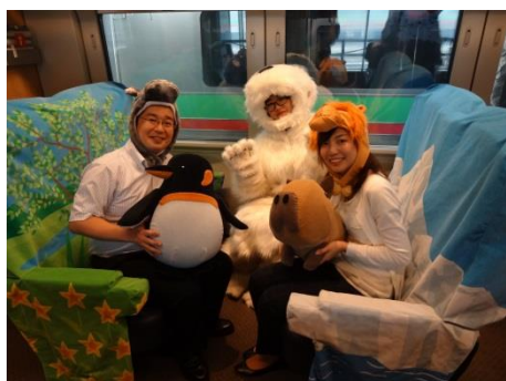
<a. ライラック旭山動物園号>