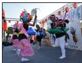
【奥津軽いまべつ・荒馬まつり】