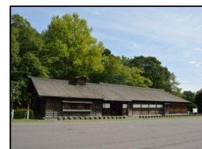
【島松・旧島松駅通所】