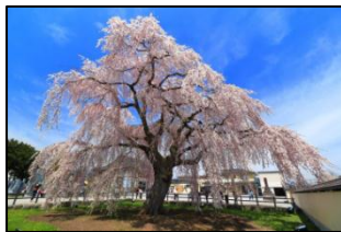
【新函館北斗・法亀寺のしだれ桜】