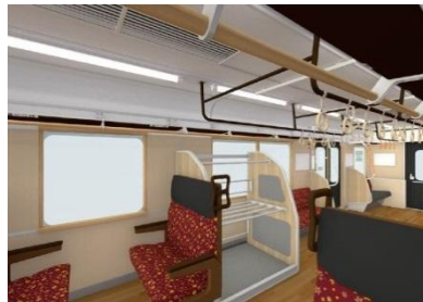
大型荷物置き場の設置