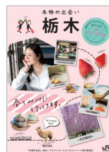
【キャンペーンガイドブック】