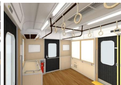
フリースペースの設置