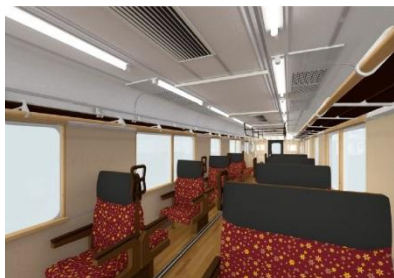
快適な大型クロスシート