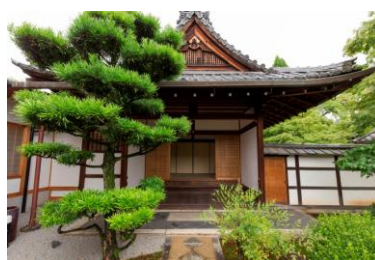
相国寺 豊光寺（外観）