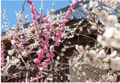
相国寺 林光院 鶯宿梅