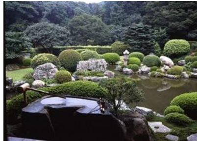
清水寺 成就院 月の庭