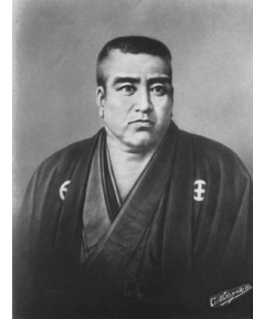
西郷隆盛肖像画 (国立国会図書館蔵)