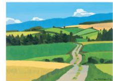
風景イラストイメージ