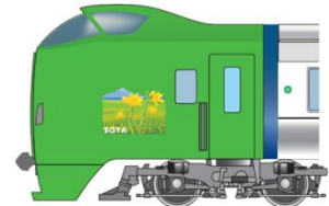
ラッピングイメージ

※どの編成で運転するかは、車両運用の都合により、お知らせできません。 ※風景イラストは、編成により枚数が異なります。 （設置されていない編成もあります）