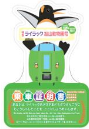
下り（札幌→旭川） ステッカー