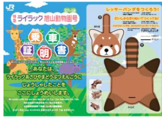
上り（旭川→札幌） ペーパークラフト

7/1（土）・2（日）限定で、 旭山動物園ポストカードも プレゼント！ （指定席のお客様限定で、乗車 証明書と一緒に配布します。）