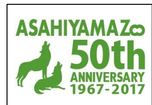
旭川市旭山動物園開園 50 周年 記念事業ロゴマーク

◇旭山動物園のイベント等については、公式ホームページをご覧ください。◇ http://www.city.asahikawa.hokkaido.jp/asahi-yamazoo/