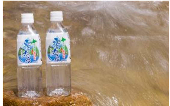
新得町ペットボトル水「雫、巡る」