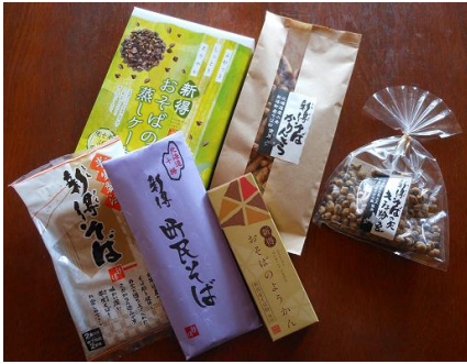
新得そばと加工品 (蒸しケーキ・ようかん等)