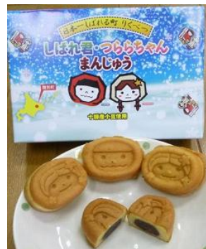
しばれ君・つららちゃん まんじゅう (陸別町)