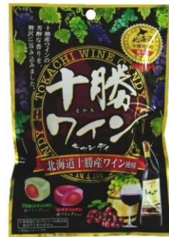
十勝ワインキャンディー