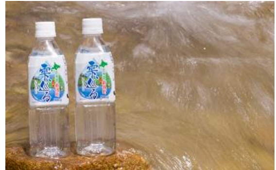
新得町ペットボトル水「雫、巡る」