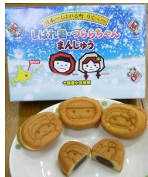
しばれ君・つららちゃん まんじゅう(陸別町)