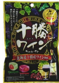
十勝ワインキャンディー