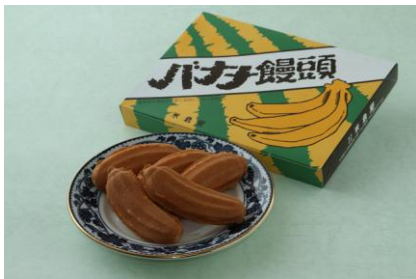
バナナ まんじゅう 饅頭