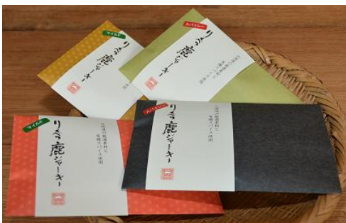
りくべつ鹿ジャーキー (陸別町)