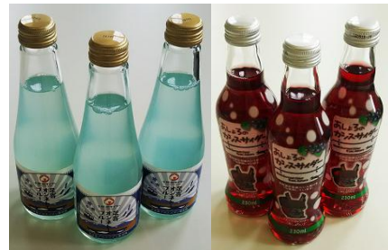
十勝地サイダー 足寄オンネトブルー(足寄町) あしよろのカシスサイダー(足寄町)