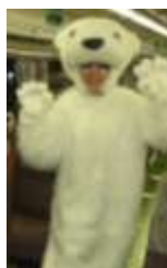
着ぐるみスタッフ

7/1 (土)・2 (日) 限定で、旭山動物園ポストカードもプレゼント！(指定席のお客様限定で、乗車証明書と一緒にお配りします。)