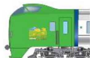
ラッピングイメージ

※どの編成で運転するかは、車両運用の都合により、お知らせできません。 ※風景イラストは、編成により枚数が異なります。 (設置されていない編成もあります)