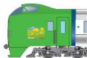
ラッピングイメージ

※どの編成で運転するかは、車両運用の都合により、お知らせできません。 ※風景イラストは、編成により枚数が異なります。 （設置されていない編成もあります）