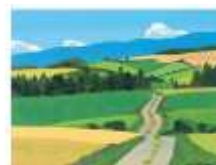
風景イラストイメージ