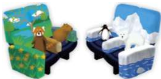
記念撮影用シート

1号車 記念撮影スペースに、旭山動物園の動物をデザインした記念撮影用シートを設置します。 ※岩見沢～深川間で実施 ※ぬいぐるみは2種ずつ日替わり