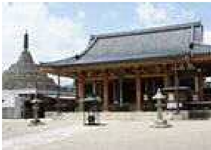
壬生寺 本堂・狂言堂