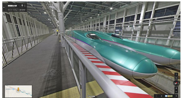
・北海道新幹線 12 番ホーム（イメージ）