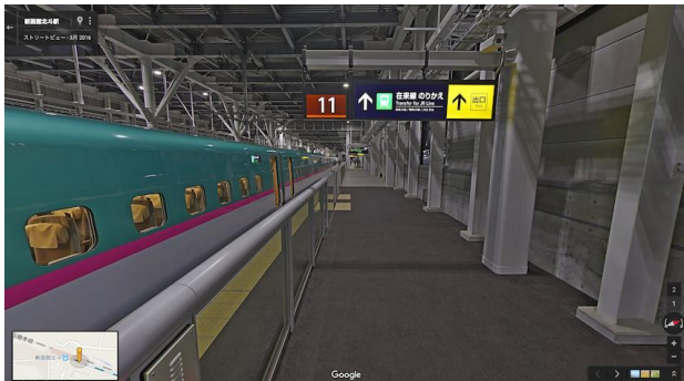
・北海道新幹線 11 番ホーム（イメージ）