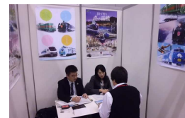
過去の商談の様子