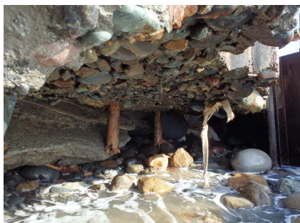
写真② 根固コンクリート下部洗掘状況