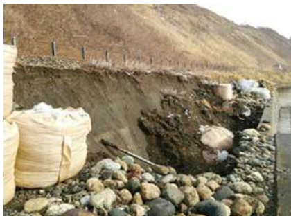
写真③ 盛土流出状況