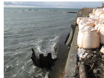
写真① 鋼矢板変形状況