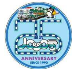
25周年限定ヘッドマーク