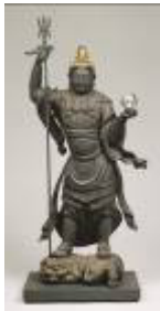
建仁寺 霊源院 「毘沙門天立像」