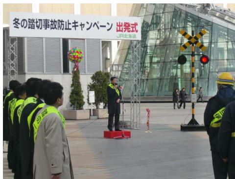
昨年度の冬の踏切事故防止キャンペーン出発式

キャンペーン期間中は、全道各地の踏切や駅で、ドライバーの皆様には「踏切手前では早めのブレーキで確実な一旦停止」、「万が一、踏切内に閉じこめられたら、そのまま車を進めて、まず脱出」、また「車が動かなくなった時には発炎筒や非常ボタン等で列車を止める」ことなどを呼びかけます。