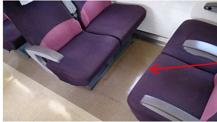
A列第1消音器上部客室内 床敷物熱変色なし