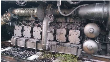
機関A列側潤滑油飛散