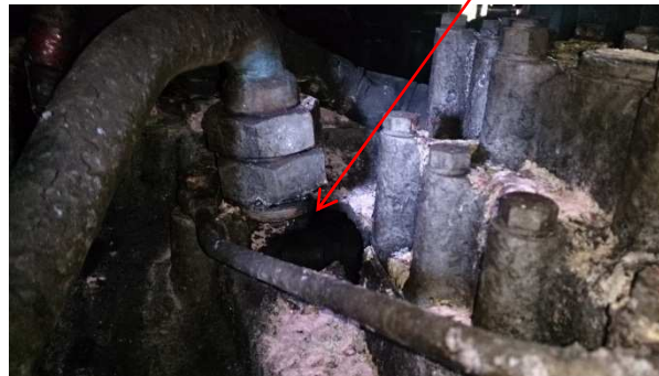
機関ブロック破損