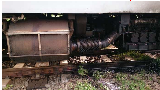
A列第一消音器変色無し、潤滑油飛散