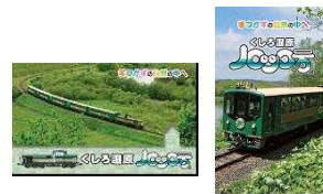
(往路) (復路) 乗車証明書イメージ

○ご購入された方には乗車証明書をプレゼント! (上り・下りでデザインが異なります)