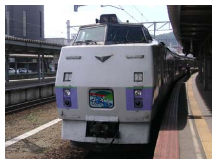
キハ183系特急型気動車(イメージ)