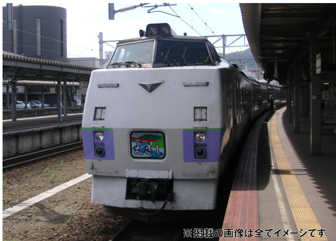
※掲載の画像は全てイメージです。

江差到着後は町内を循環する、臨時列車ご乗車のお客様専用のシャトルバスを運行しますので、江差追分会館や開陽丸、中村家や横山家など、歴史情緒溢れる江差の町をお楽しみください。