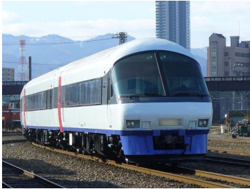
変更前の車両（ニセコエクスプレス車両）