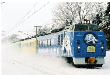
変更前の車両（旭山動物園号車両）