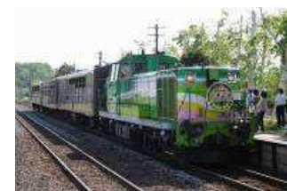
富良野・美瑛ノロッコ号