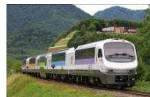
「まんぷくサロベツ号」に使用するノースレインボー車両