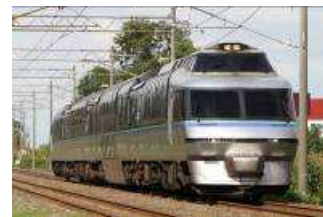
フラノラベンダーエクスプレス (クリスタル車両)