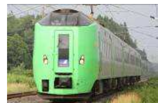
「スーパー白鳥号」に使用する789系特急電車

※運転日：○印(白鳥71～74号運転および74・95・96号新青森～弘前間延長運転)