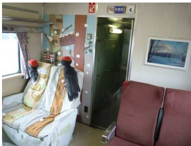
4号車ヌプリシート「クマガラの森」

4号車に設置されていたヌプリシート「クマガラの森」、ラッピングは設置されない車両での運転となるほか、ヘッドマーク、行先表示は「臨時」として運転します。