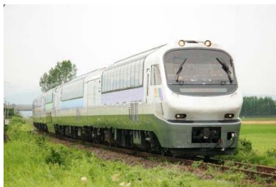
変更前の車両（ノースレインボー車両）