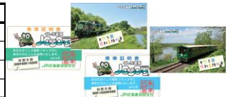
乗車証明書イメージ

○ご乗車された方には乗車証明書をプレゼント！(上り・下りでデザインが異なります)