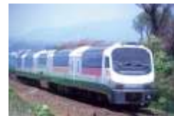
(ノースレインボー車両)

下り 札幌駅 12:30 発/稚内駅 18:11 着 上り 稚内駅 13:45 発/札幌駅 19:08 着 ※時刻・停車駅ともに特急サロベツ号と同様