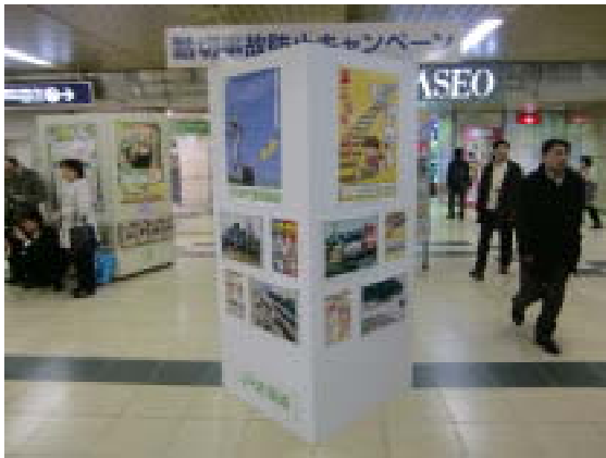
【駅コンコースパネル展による啓発】

また、線路内立ち入りや置き石等の禁止の呼びかけを学校や幼稚園、地域の方々と協力して行います。