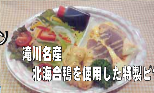
滝川名産 北海合鴨を使用した特製ピザ

富良野にあるフランス料理店「ピストロ ル・シュマン」では地元富良野や近郊の農家が育てる新鮮な野菜や自家製酵母パン等を使用し、手間暇惜しまず心をこめた料理を作っています。今回はこのフレンチレストラン特製のランチボックスをご堪能ください。