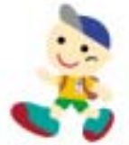
ヘルシーウォーキング キャラクター・歩くん