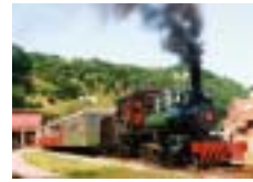
SL アイアンホース号