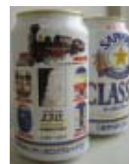
クラシック 「北海道鉄道130周年記念缶」