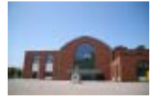
小樽市総合博物館