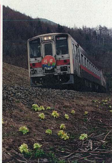
急行「礼文」(イメージ)

オプションであなたの名前が入ったエンブレムタイプ記念乗車証もございます。 (+5,000円) 7月9日までに事前申込が必要です。 参加者限定。 ※下図はイメージです。