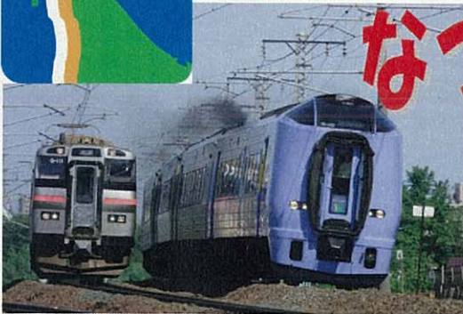
特急「スーパー宗谷」(右)