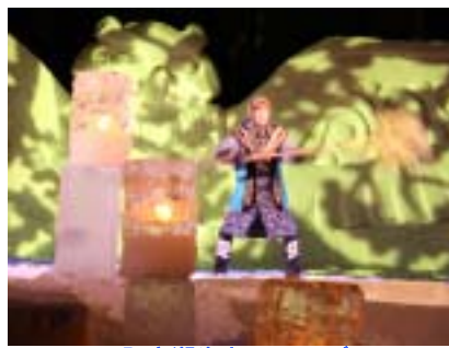
阿寒湖氷上フェスティバル ICE・愛す・阿寒「冬華美」 1月23日(土)～3月22日(月・祝)

氷点下20度以下で見られる氷の結晶を会場内で実際に発生させ、ライトにキラキラ輝くダイヤモンドダスト現象を体感できます。