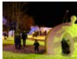
北の新大陸発見! あったか網走 1月30日(土)～3月7日(日)

大自然がつくり出す美しい風景やそこに暮らす野生の猛禽類など、知床には絶好の被写体が数多くあります。プロの写真家と一緒にフォトジェニックな知床を巡るツアーです。