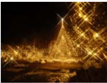
ダイヤモンドダストパーティー 2月28日(日)まで

氷点下20度以下で見られる氷の結晶を会場内で実際に発生させ、ライトにキラキラ輝くダイヤモンドダスト現象を体感できます。