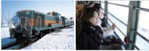
「流水ノロッコ号」 車窓から見るオホーツク海の流水 編成: 全車禁煙、5両編成(指定席2両・自由席3両)