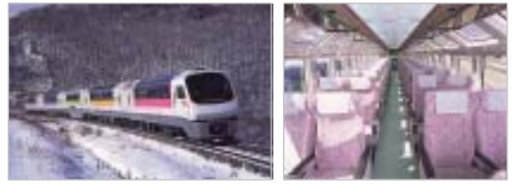
「流水特急オホーツクの風」 車内は快適なリゾート客室 編成: 全車禁煙、5両編成(指定席4両・自由席1両)