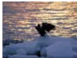
知床ARTISTIC WEEK 2010 2月19日(金)～21日(日)、 26日(金)～28日(日)

半世紀ほど前、実際に知床に現れたオーロラをダイナミックな音響、麦わらの煙、レーザー光線で再現。今年はいリニューアルし、3つのテーマが日替わり。