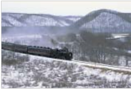
湿原に汽笛がこだまする「SL冬の湿原号」