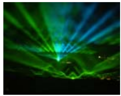
知床ファンタジー 2月5日(金)～3月21日(日)

全面氷結した湖上で行われる阿寒ならではの冬のイベント。期間中毎夜花火が打ち上げられます。