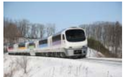
ノースレインボー車両