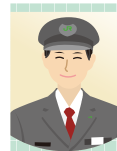
B 車掌所 車掌 Tさん

社会人兼大学生として生活するのは本当に苦勞しますが、迷っているなら一歩踏み出して行動し、後悔することの無いようにして欲しいです。社内選考試験や入学後の学習について不安があれば、社内の先輩方からアドバイスできることもありますので、気後れすることなく挑戦してみると良いと思います。