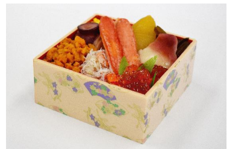
開発中商品イメージ

コンセプトは海の幸を贅沢に盛り込んだ海鮮弁当。 素材そのままのうま味をご堪能頂けるようにスチーム調理した、棒ズワイガニと北寄貝、自家製の味付数の子をメインに、その他、数種類の海鮮食材等をお楽しみ頂けるよう開発中です。