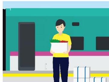
②新函館北斗駅にて特産品を 新幹線に積み込み