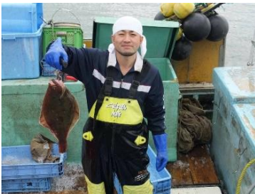
①地域特産の鮮魚類を水揚げ