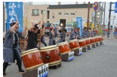
稚内海峡太鼓保存会 演奏の様子

※折り返しとなります音威子府駅において、「風っこ そうや1号」出発場面では、音威子府駅長と音威子府中学校の生徒による出発合図を13時22分頃、駅ホームにて行います。