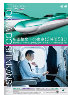
JR 東日本版イメージ