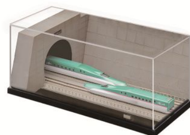
最優秀賞 (賞品イメージ)