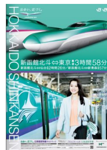
JR 北海道版イメージ