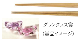
グランクラス賞 (賞品イメージ)