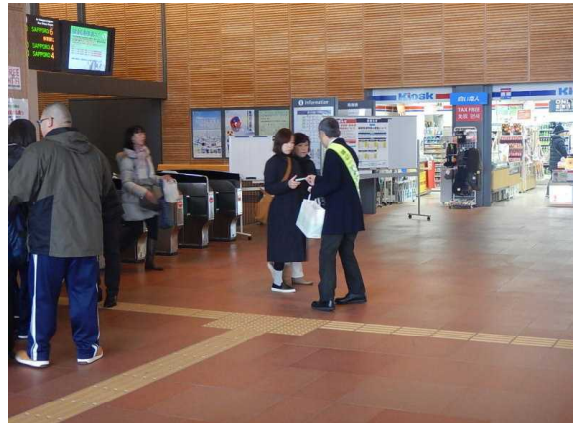
踏切事故防止キャンペーンの様子