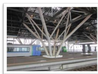
四叉柱支承部のホーム柱 (イメージ)