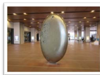
安田侃「天秘」(イメージ)