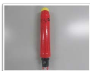
信号炎管(イメージ)