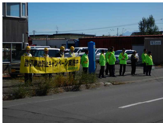
踏切事故防止キャンペーンの様子