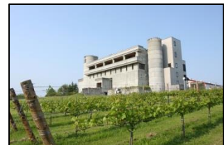
【池田・池田ワイン城】