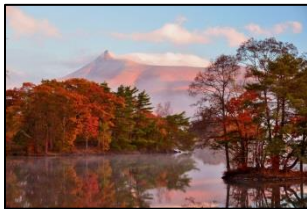
【大沼公園・大沼湖畔】