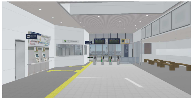
<駅舎 柵外コンコース>