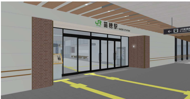
<駅舎 エントランス(自由通路側)>